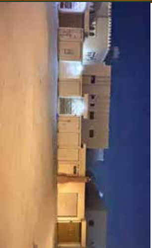
صور من الطبيعة توضح الموقع