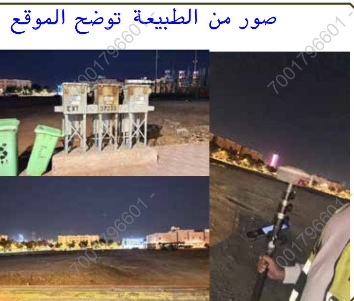
صور من الطبيعة توضح الموقع