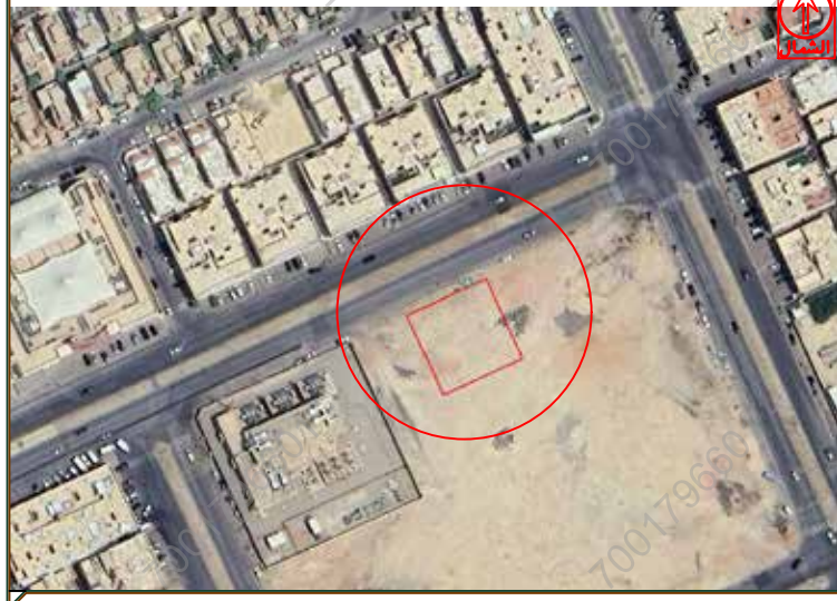
مقياس الرسم ٢٥٠/١