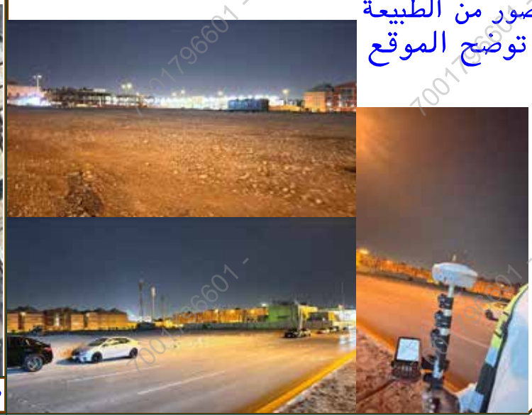
توضيح الموقع صور من الطبيعة