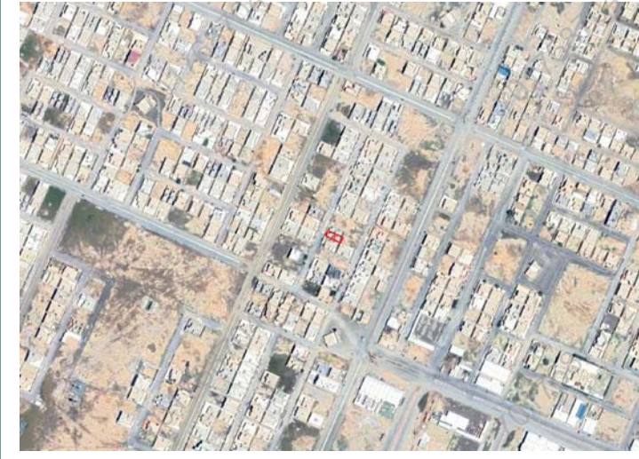
مقياس الرسم ٢٥٠٠/١