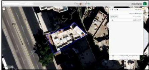
صور من الطبيعة