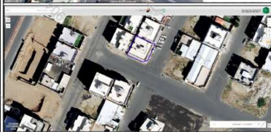
صور من الطبيعة