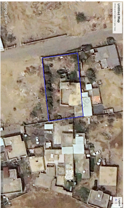
صور من الطبيعة