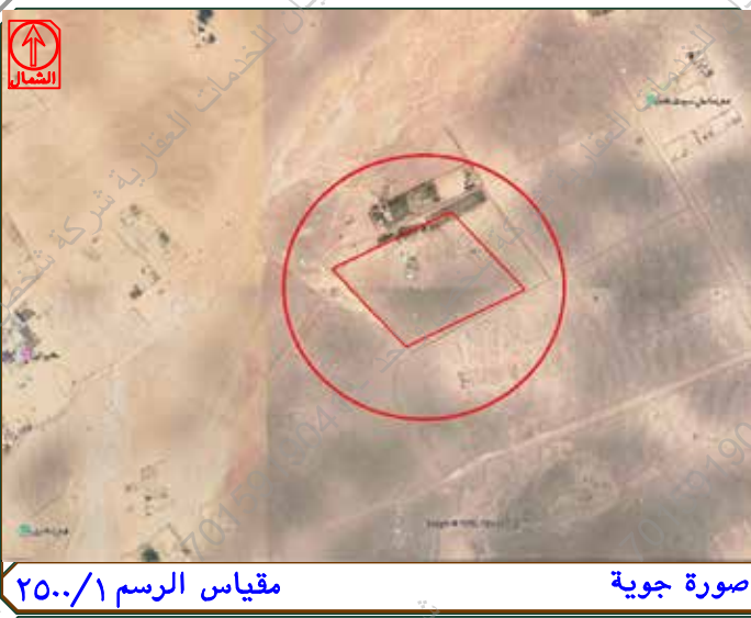
مقياس الرسم ٢٥٠/١