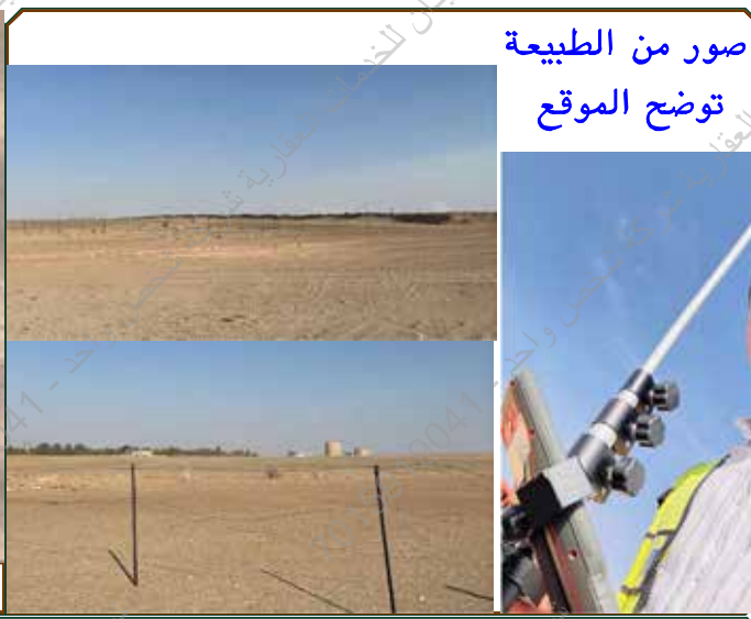
صور من الطبيعة توضح الموقع