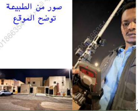
صور من الطبيعة توضح الموقع