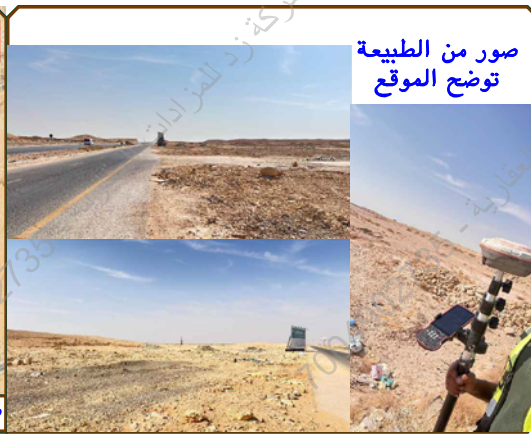
صور من الطبيعة توضح الموقع